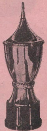
Nr. 15, 16