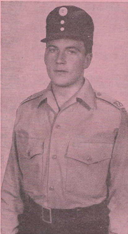
Art. Nr. 105/1

Die Dienstgradabzeichen werden in Form von Aufschiebeschlaufen getragen: